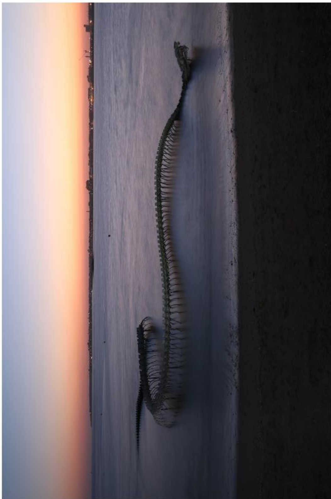
"Le serpent d'Océan" de Huang Yong Ping en aluminium 2012 à Saint Brevin les Pins en Loire Atlantique en France. Longueur : 130 mètres 135 vertèbres.