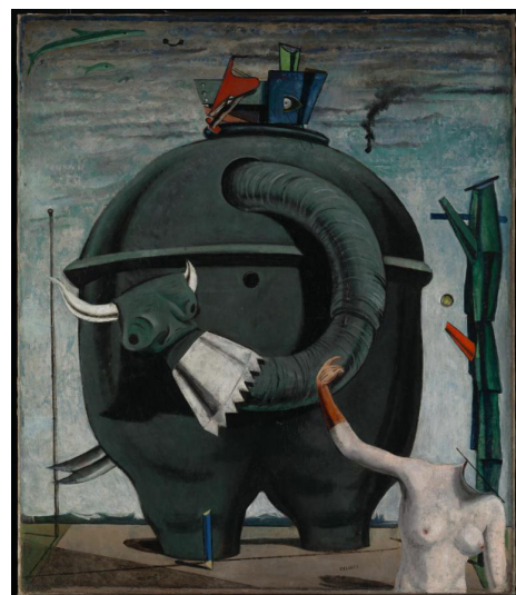
L'éléphant de Célèbes - 1921 huile sur toile - 125,4 x 107,9 cm Tate Gallery / Londres

Max ERNST (1891 - 1948) - artiste allemand