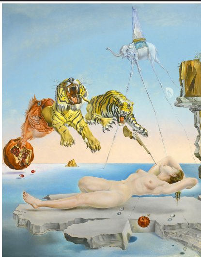
Rêve causé par le vol d'une abeille autour d'une grenade, une seconde avant l'éveil 1944 huile sur bois 51 x 41 cm Museo Thyssen Bornemisza / Madrid (Espagne)

René MAGRITTE (1898 - 1967) - artiste belge