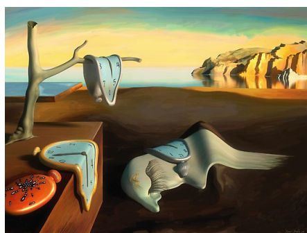
La persistance de la mémoire - 1931 huile sur toile - 24 x 33 cm Museum of Modern Art / New-York

Salvador DALI (1904 - 1989) - artiste espagnol